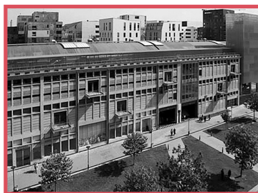
La halle aux Farines (workshops, seminars and planaries)

Weitere Fragen rund um die ESU beantworten wir unter ESU@attac.de