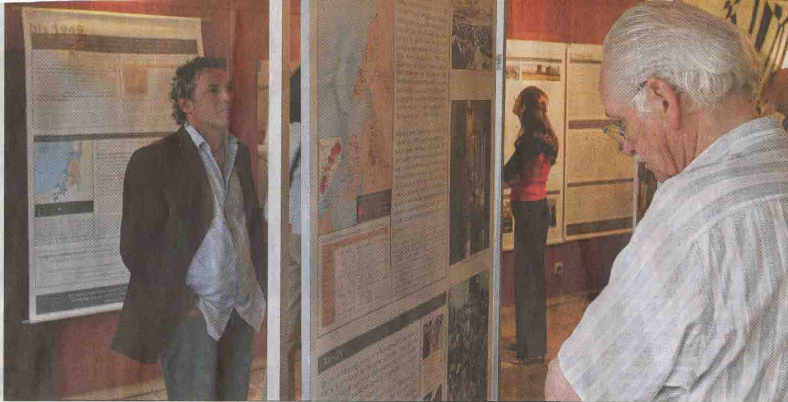
Einen historischen Rückblick auf die Geschichte der Palästinenser im vergangenen Jahrhundert bietet die Ausstellung „Die Nakba“ („Katastrophe“, ein Ausdruck, der im arabischen Sprachraum die Gründung des Staates Israel am 14. Mai 1948 bezeichnet). Besucher sollten etwas Zeit zum Lesen der ausführlichen Texte mitbringen.

Es sei nötig, dies derart herauszustellen, erklärte der emeritierte Phi-