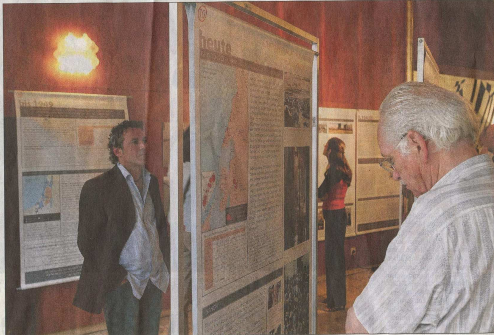
Einen historischen Rückblick auf die Geschichte der Palästinenser im vergangenen Jahrhundert bietet die Ausstellung „Die Nakba“ („Katastrophe“, ein Ausdruck, der im arabischen Sprachraum die Gründung des Staates Israel am 14. Mai 1948 bezeichnet). Besucher sollten etwas Zeit zum Lesen der ausführlichen Texte mitbringen.

Es sei nötig, dies derart herauszustellen, erklärte der emeritierte Phi-