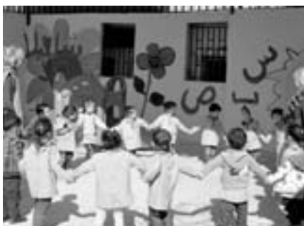
Im NISCVT-Kindergarten des Flüchtlingslagers Schatila

Wir suchen wieder PatInnen, die bereit sind, einem palästinensischen Flüchtlingskind im Libanon drei Jahre lang für 15€ monatlich einen Kindergartenplatz zu finanzieren. Dies ist für das Kind nicht nur die beste Grundlage für einen erfolgreichen Schul- und Ausbildungsweg, sondern auch für eine gedeihliche Persönlichkeitsentwicklung.