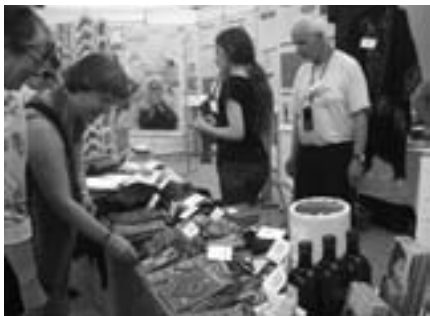
Auf dem Kirchentag in Stuttgart

Mit 16 Mitgliedern haben wir unseren Verein wieder drei Tage lang auf dem Markt der Möglichkeiten beim Evangelischen Kirchentag in Stuttgart präsentiert. Trotz großer Hitze war das Interesse an unseren Projekten, unseren Stickereien und an der Nakba-Ausstellung sehr groß. Es haben sich viele gute Gespräche und Diskussionen ergeben, so dass sich unsere Teilnahme erneut als fruchtbar herausgestellt hat.