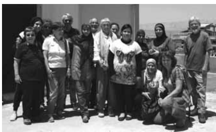
Besuch in Wavell

Für die mitreisenden PatInnen waren die bewegenden Begegnungen mit ihren Patenkindern und deren Familien das Highlight der Reise. Auch für uns war der Besuch bei unserem Patenkind in Wavell, mit dem wir seit 18 Jahren verbunden sind, ein besonders berührendes Erlebnis. Wir freuen uns über die gute Entwicklung des jungen Mädchens, das zurzeit eine Ausbildung zur Krankenpflegerin macht. Sie hat im Sommer ihre Abschlussprüfung und die Aussicht, in einem Krankenhaus angestellt zu werden.