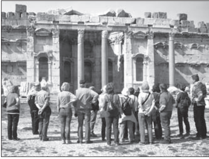
Vereinsreise 2016: Besuch in Baalbek

Teilnehmer-Zahl: 15-20 Personen, Reisepreis: voraussichtlich ca. 1700€ (genaue Kalkulation liegt noch nicht vor) Leistungen: Im Preis enthalten sind Flug, Übernachtung, Halbpension, Eintrittsgelder, Bustransfer im Libanon, Trinkgelder