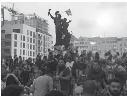
Demonstration gegen die Regierungspolitik, Beirut

Auch die Hunderttausende von Flüchtlingen aus Syrien sind immer weniger geduldet. Sie werden vermehrt nach Syrien abgeschoben. Das durch die vielen Flüchtlinge wegen des Überangebots an Arbeitskräften beständig sinkende Lohnniveau hat auch viele Libanesen in große Armut gestürzt. Der hoch verschuldete libanesische Staat ist nicht in der Lage, die Grundbedürfnisse der eigenen Bevölkerung nach Bildung, Gesundheit, Strom- und Trinkwasserversorgung oder auch Müllbeseitigung zu befriedigen. Der wachsende Unmut hat sich in den jüngsten Protesten der libanesischen Zivilgesellschaft Luft